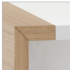
цвет — белый, зебрано