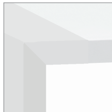
цвет — белый